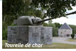
Tourelle de char