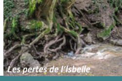
Les pertes de l'Isbelle