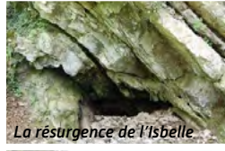
La résurgence de l'Isbelle