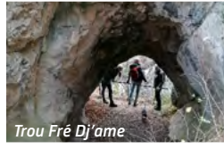
Trou Fré d'Jame