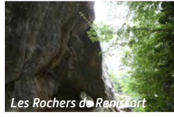
Les Rochers de Reissart